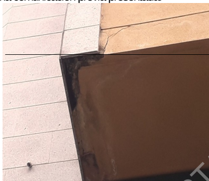
Foto de xaneiro do 2019 Como se pode apreciar nesta imaxe o voo atópase nas mesmas condicións.

Efectuada nova visita ao lugar en data do 23 de maio do 2019, compróbase que seguen existindo fendas no acabado do monocapa dos voos, o que reflicte que non se ten executado a obra de reparación, tal e como consta na comunicación previa presentada.