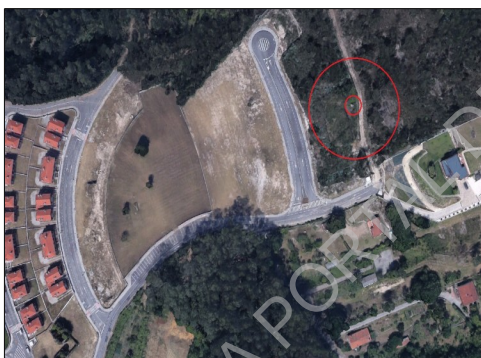
Imaxe do lugar

Segundo o informe o pozo tapado ten unha porta que no momento da inspección tiña a porta aberta, pero cunha "tranca" colocada para impedir o acceso.