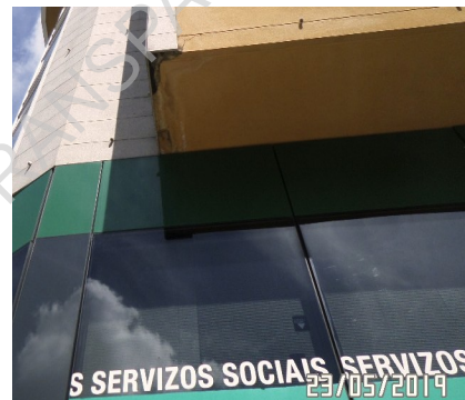
Foto de maio do 2019