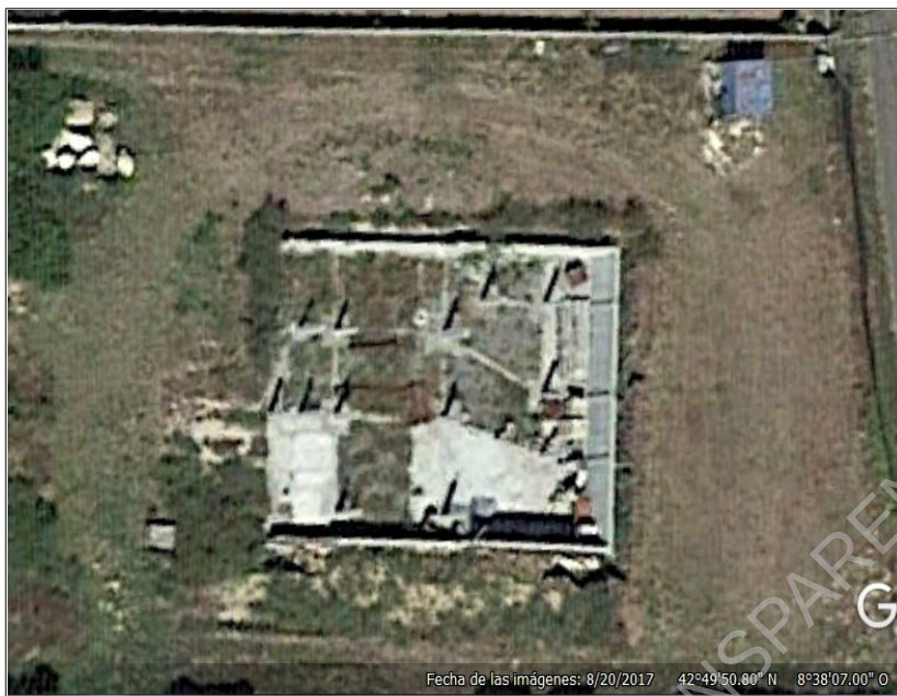
Imaxe de Google de agosto do 2017

Como se pode apreciar na imaxe anterior de agosto do 2017 e nas fotografías que realizou a Policía Local en decembro do 2018, a obra, soamente neste período de mais dun ano, non sufriu modificación, isto é, non se executou obra algunha.