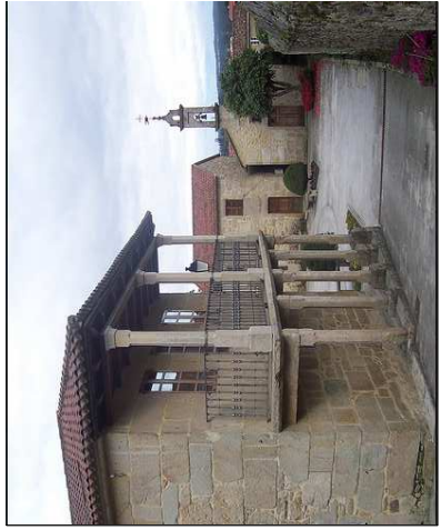
6 PAZO DA PEREGRINA